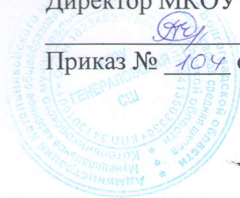
ГРАФИК ПИТАНИЯ ( ОВЗ)